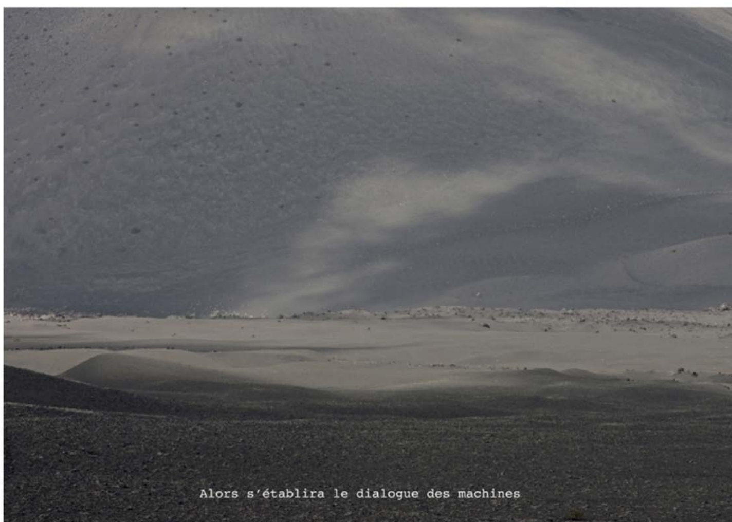
Inscriptions #032, tirage pigmentaire (2018) sur papier Baryta contrecollé sur Dibond, 49,5 x 70,5 cm, Edition de 4

Ce n'est pourtant pas la première fois que Michel Houellebecq est au cœur d'une exposition. La première, Before Landing , organisée en 2014 au Pavillon Carré de Baudoin, expose ses photographies de la France, en proie à un phénomène de désindustrialisation. Au même moment à la Galerie Binôme, l'auteur des Particules Élémentaires se fait pour la première fois critique d'art en écrivant le texte d'exposition des 500 portraits pris par Marc Lathuilière à travers la France. Comme une prophétie auto-réalisatrice, Michel Houellebecq qui s'était lui-même imaginé critique d'art dans La Carte et le Territoire (Prix Goncourt 2010) pour le compte du personnage Jed Martin, dépasse alors la fiction.