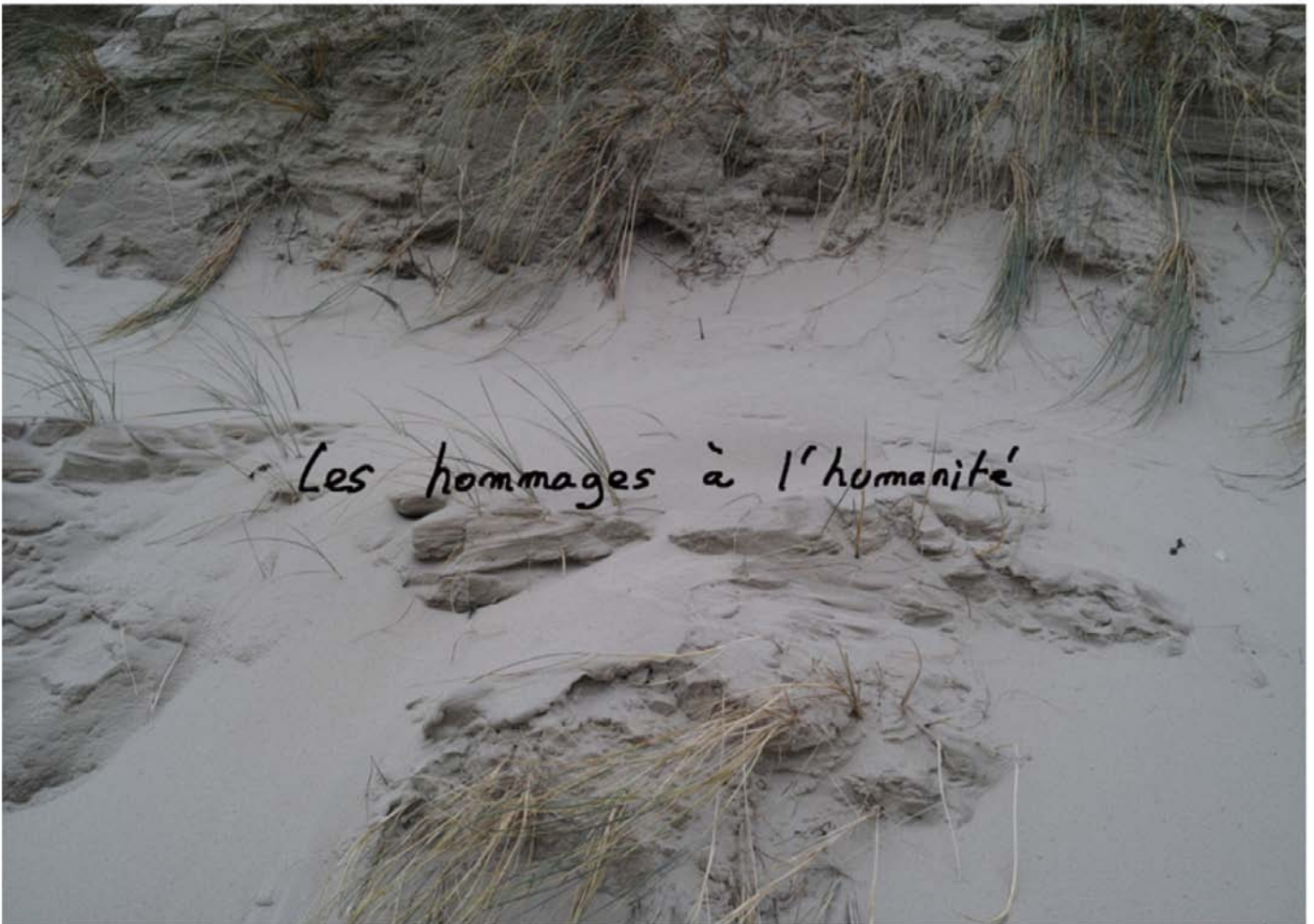
Inscriptions #038, tirage pigmentaire sur papier Baryta contrecollé sur Dibond, 49,5 x 70,5 cm, Édition de 4

Les gros plans fixent le fleuve rouge de Río Tinto en Espagne ou le macadam d'une rue pavée. Alors que le travail de Houellebecq est connu pour ses réflexions (sur le rapport à la nature, le temps qui passe, la mort, et le sens de l'existence), aucune de ses photos ne comporte une quelconque présence humaine. Tandis que les pensées de Houellebecq persistent, la civilisation, elle, semble avoir disparue. Seul l'Amour offre une perspective joyeuse, celle d'un chemin que rien n'arrête. Une forêt traversée par une route infinie, qui se perd dans l'horizon. Pour la contempler, le visiteur peut écouter la chanson Crépuscule et s'émerveiller devant la poésie de l'auteur : " Nous avions des moments d'amour injustifié ". La cohérence des formes – quatrains, photos, musique – trouble, tant elle paraît limpide.